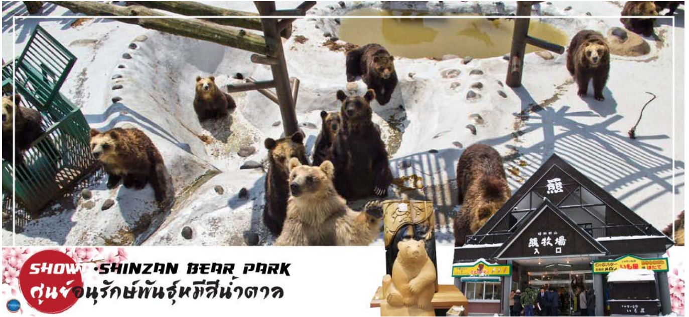
SHOW SHINZAN BEAR PARK ศูนย์อนุรักษ์พันธุ์หมีสีน้ำตาล

นำท่านชม ศูนย์อนุรักษ์พันธุ์หมีสีน้ำตาล (Bear Park) ซึ่งเป็นหมีพันธุ์ที่หาได้ยากในปัจจุบัน จะพบแต่ในเกาะฮอกไกโด เกาะซาคาฮาริน และหมู่เกาะคูรินเท่านั้น เรียกได้ว่าเป็นจุดนำแวะของคนรักเจ้าหมีสีน้ำตาลที่พลาดไม่ได้เลย