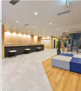
Hotel Flexstay Hakodate Ekimae